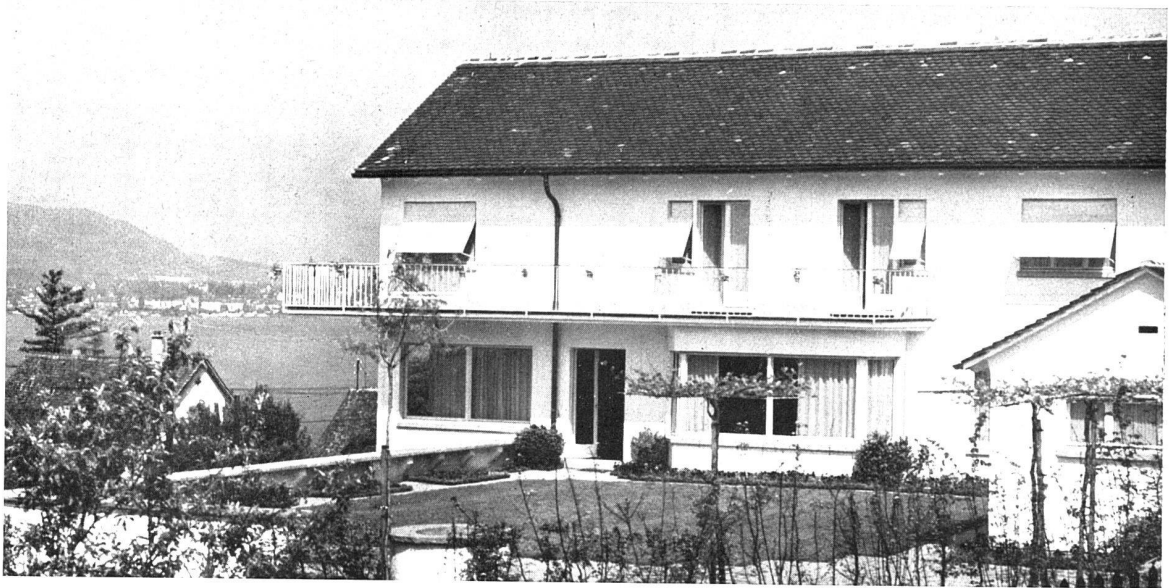
Haus Diem Zollikon (Zürich) Laubi & Bosshard, Architekten, Zürich