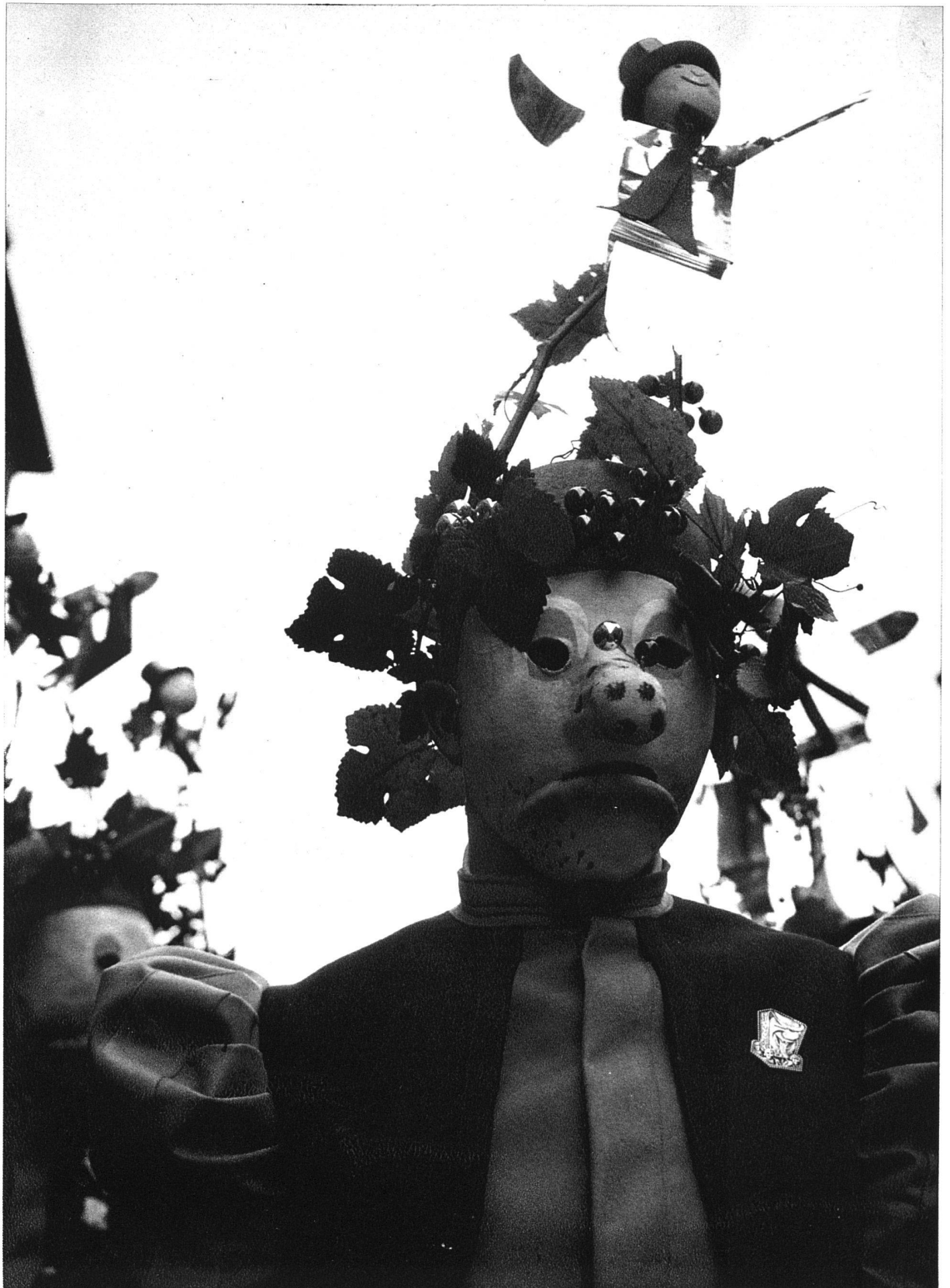
«Sauce fédérale» 1936 (geht auf den aus Wein aller Landesgegenden gemischten Einheitsweisswein). Tambour als «Bundesdubel». Larve violett und grün, auf dem Kopf künstliches Reblaub mit Beeren und Spatzenschreck aus Stanniol, Kostüm herbstbrauner Filz mit schwarzem Kittel. Entwurf K. Hindenlang, Basel