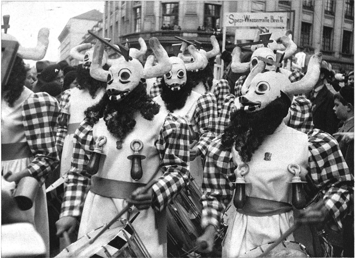
Tambouren als Milchgeister vom «Grellinger Milchkrieg» (eine Bauernbewegung gegen die Ablieferungspflicht der Milch an genossenschaftliche Zwangsorganisationen). Weisse Köpfe mit Beil und Rosshaarbärten, Kostüm weisser und roter Kölsch mit weissem Filz Trommler- und Pfeifercliquen von der Basler Fasnacht Larven und Kostüm entworfen von Maler K. Hindenlang, Basel. Tambouren als «Basler Ochsen» aus der Gruppe «Wiener Walzer» (Musikdirektor Weingartners Abschied), 1935