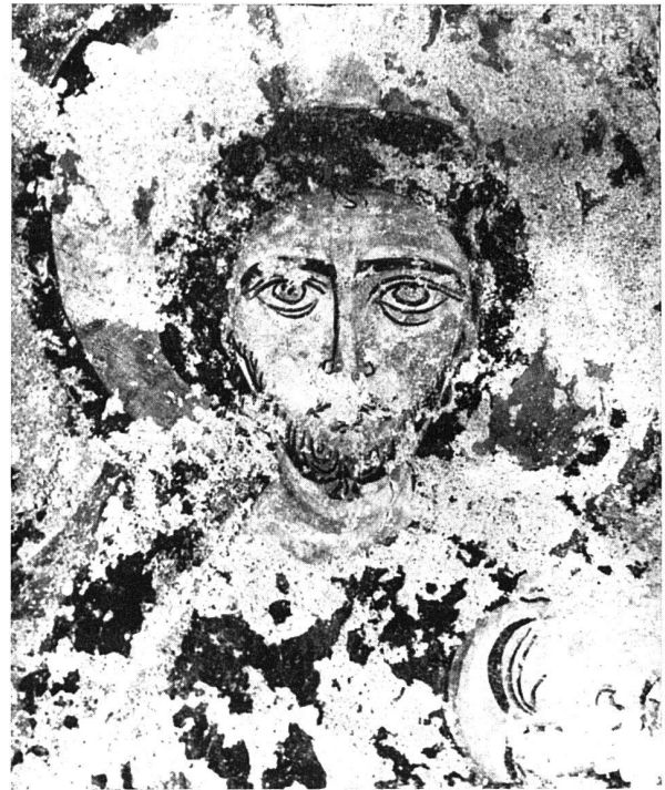
Neu aufgedeckte Wandgemälde in der Marienkirche zu Pontresina. Fragmente der älteren Freskenschicht aus dem XI. und XII. Jahrhundert (durch die Magdalenenfresken übermalt) oben Christuskopf, unten die Anbetung der drei Könige (rechts die Madonna, durch den weissen Fleck zerstört)