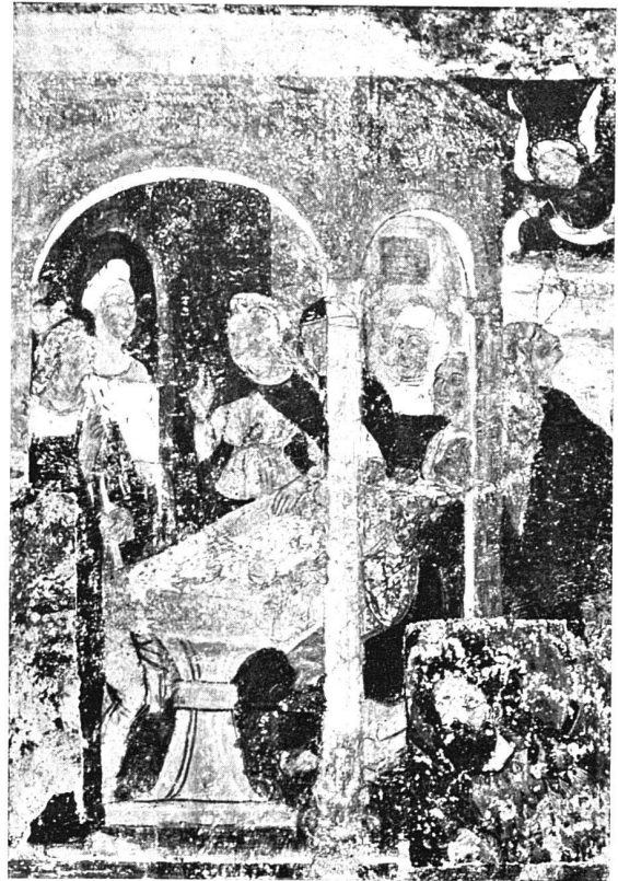
Neu aufgedeckte Wandgemälde in der Marienkirche zu Pontresina Szenen aus der Legende der heiligen Magdalena, XV. Jahrhundert