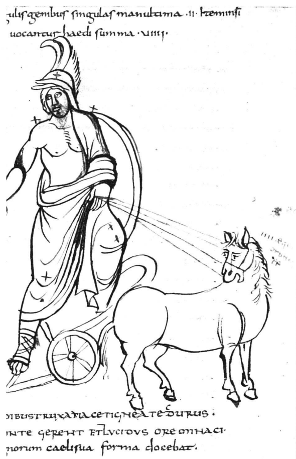
Beispiel einer abgekürzten bildlichen Darstellung; rechts vom Pferdekopf die Beischrift «III aequi debent esse»

Der nachfolgende Abschnitt bildet den Schluss des Kapitels über die schweizerischen Ordenskirchen der romanischen Epoche. In diesem Kapitel wird ausgeführt, wie einzelne Elemente des neuerdings wieder so sehr umstrittenen St. Galler Klosterplanes in der sogenannten «Einsiedler Gruppe» des XI. Jahrhunderts bestimmend geworden sind (quadratischer Schematismus, Querschiff ohne Chorkammern u. a.), und wie gleichzeitig in den Abteikirchen von Romainmôtier und Payerne seit etwa dem Jahre 1000 die «moderneren» cluniazensischen Formen in den Gebieten der heutigen Schweiz auftreten. Die Neuerungen Clunys betreffen vor allem die Ostpartien der Kirchen; während die zweite Anlage in Cluny (seit 981) und ihr entsprechend die Peterskirche in Hirsau drei Apsiden und zwei an die Querschiffarme angebaute Apsidien besaßen, liegt Romainmôtier mit drei Apsiden vor dieser Stufe und Payerne mit seinen fünf gestaffelten Apsiden nach ihr. Der ursprünglich für beide Anlagen identische offene Vorhof ist in Romainmôtier in die um 1100 gebaute Vorkirche umgewandelt, in Payerne gleichzeitig zum Langhaus geschlagen worden.