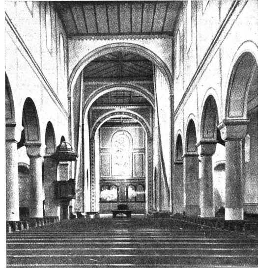
Schaffhausen. Allerheiligenmünster, 1087–1104

3. Der retrospektive Charakter zeigt sich weiterhin in der Ostpartie. Den fünffach gestaffelten Chorgrundriss von Cluny übernimmt Hirsau sozusagen im Augenblick seiner Entstehung, das heisst dort, wo er, gleich Anzy-le-Duc und Cérisy-la-Forêt, das äussere Kapellen-