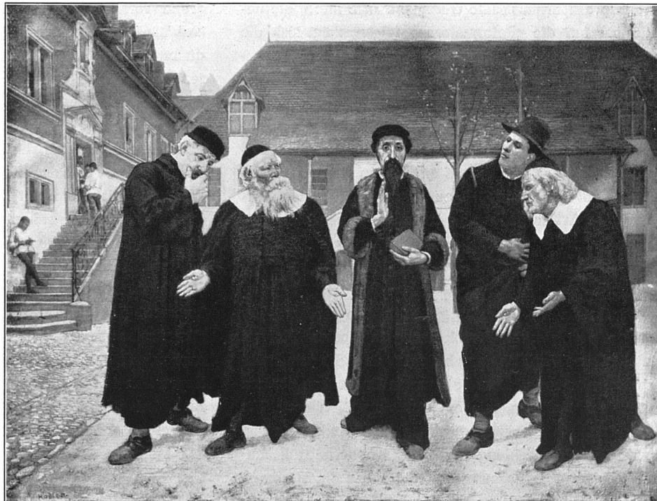
«Die Reformatoren» Genf, Musée d'Art et d'Histoire 1,005 × 1,305 m, 1883/84