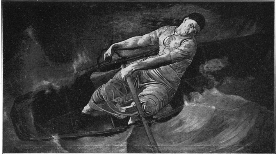
«Das mutige Weib» Basel, Kunstmuseum 0,98 × 1,70 m, 1886

Hodlers die ungewöhnliche und für den mit Zäsuren rechnenden Historiker sehr erschwerende Stetigkeit. Es existieren Bilder aus der Mitte der 70er Jahre, also aus seiner frühesten Zeit, die man ohne Mühe und grosse Schulung als Hodler bestimmen würde, auch wenn man nur etwa reife expressionistische Werke der 90er Jahre kannte; ich erinnere beispielshalber an den «Schüler» im Basler Museum. Durch diese Stetigkeit ist es sehr schwer, den «Anfang» der expressionistischen Phase, wenn von einem solchen überhaupt gesprochen werden darf, zu erkennen. Wir werden noch sehen, dass diese keineswegs belanglose Bestimmung nicht unmöglich ist. Da die expressionistische Phase ohne Bruch, also sehr leicht einsetzt, geschieht dieses Einsetzen ungewöhnlich früh.