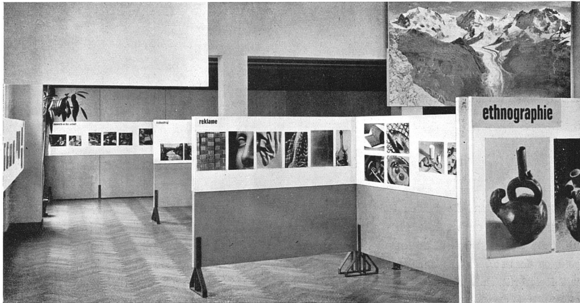
«Der Berufsfotograf, sein Werkzeug und seine Arbeiten». Ausstellung im Kunstgewerbemuseum Basel

terialstudien an Natur- und industriellen Gegenständen, Reportagen, typische Landschafts- und Stadtaufnahmen, Fotos für Reklamezwecke in Gestalt von Plakaten, Prospekten oder Buchgrafik.