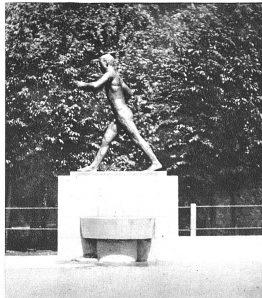
Der «Läufer» auf der Spielwiese Zürich-Oerlikon Gesamtansicht