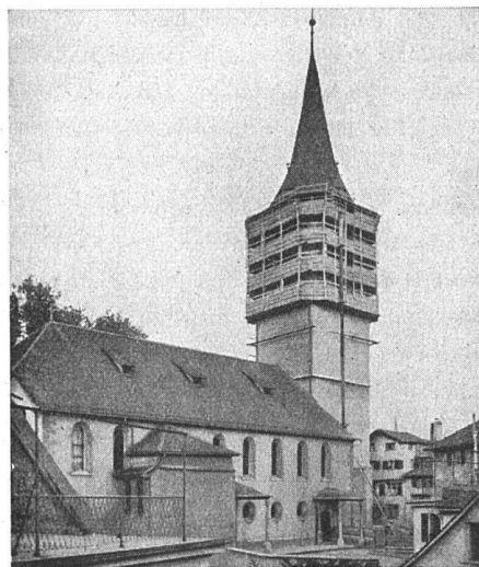
rechts: Kirche St. Peter Zürich

Vertreter in allen grösseren Kantonen • Mietweise Erstellung für Neu- und Umbauten durch