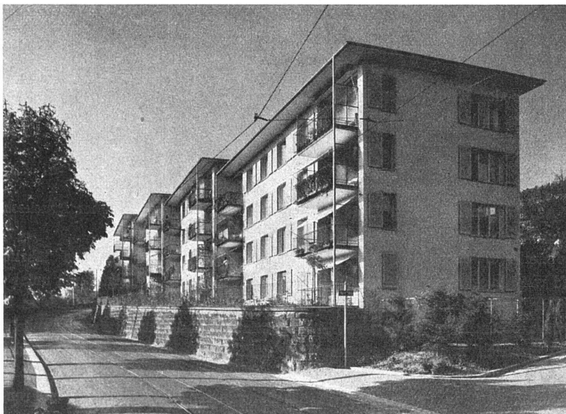
Wohnkolonie Oeristeig, Zürich Allgemeine Baugenossenschaft Zürich Arch.: Kellermüller & Hofmann, Zürich

Flachdächer, ca. 1500 m 2 , mit teerfreier Dachpappe «Turicum» der Asphalt- Emulsion A.-G., Zürich, ausgeführt durch die Genossenschaft für Spengler-, Installations- und Dachdecker- arbeit, Zürich 4