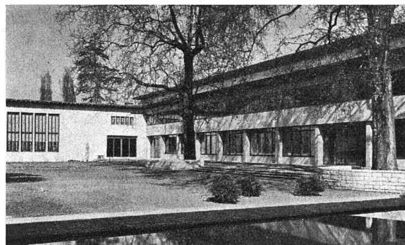
Gartenhof, unten Ansicht vom Petersplatz