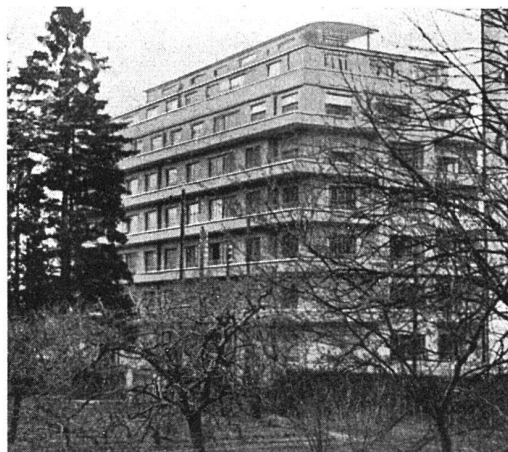
Immeuble locatif «Le Vieux mur», Avenue de Champel R. Murset, arch.

Die Ausstellung im Musée d'Art et d'Histoire in Genf umfasst eine Auslese aus der wertvollsten Sammlung der Welt, die ihrerseits schon im Rufe steht, nur eine Auslese wirklicher Meisterleistungen zu sein. Es heisst, dass man die schönsten Tiziane, die besten (nicht die grössten) Gemälde von Rubens im Prado suchen müsse, der seit dem XVI. Jahrhundert von den spanischen Königen aufs sorgsamste betreut wurde. Das Ziel dieser Kunst-