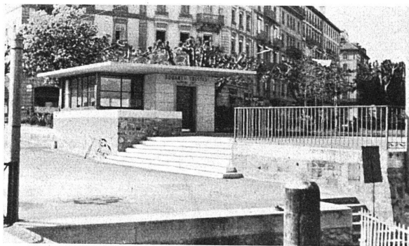
Edicule des Douanes, Promenade du lac. A. Cingria, arch.

pflege war, eine vollständige Sammlung der nationalen spanischen Kunst in ihren besten Vertretern zu erreichen und mit ihnen eine Anzahl streng ausgewählter ausländischer Meister zu vereinen. Jedes Stück wäre wert, zum Hauptgegenstand einer Betrachtung gemacht zu werden. Wie sehr diese Konzentration auf höchste Meisterschaft den Kunstgenuss intensiviert und läutert, erlebt man in Genf vielleicht zum erstenmal. Der Zahl und Intimität der