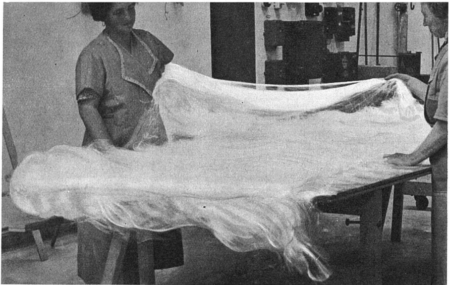
Stränge von Glasseide werden zu Matten zusammengelegt

der Büroräume des Neubaus der Schweiz. Rentenanstalt in Zürich und die Hörsäle und Laboratorien des Neubaus des Kantonalen Technikums in Winterthur, die beide mit Strahlungsheizung versehen sind, mit Glasseide isoliert.