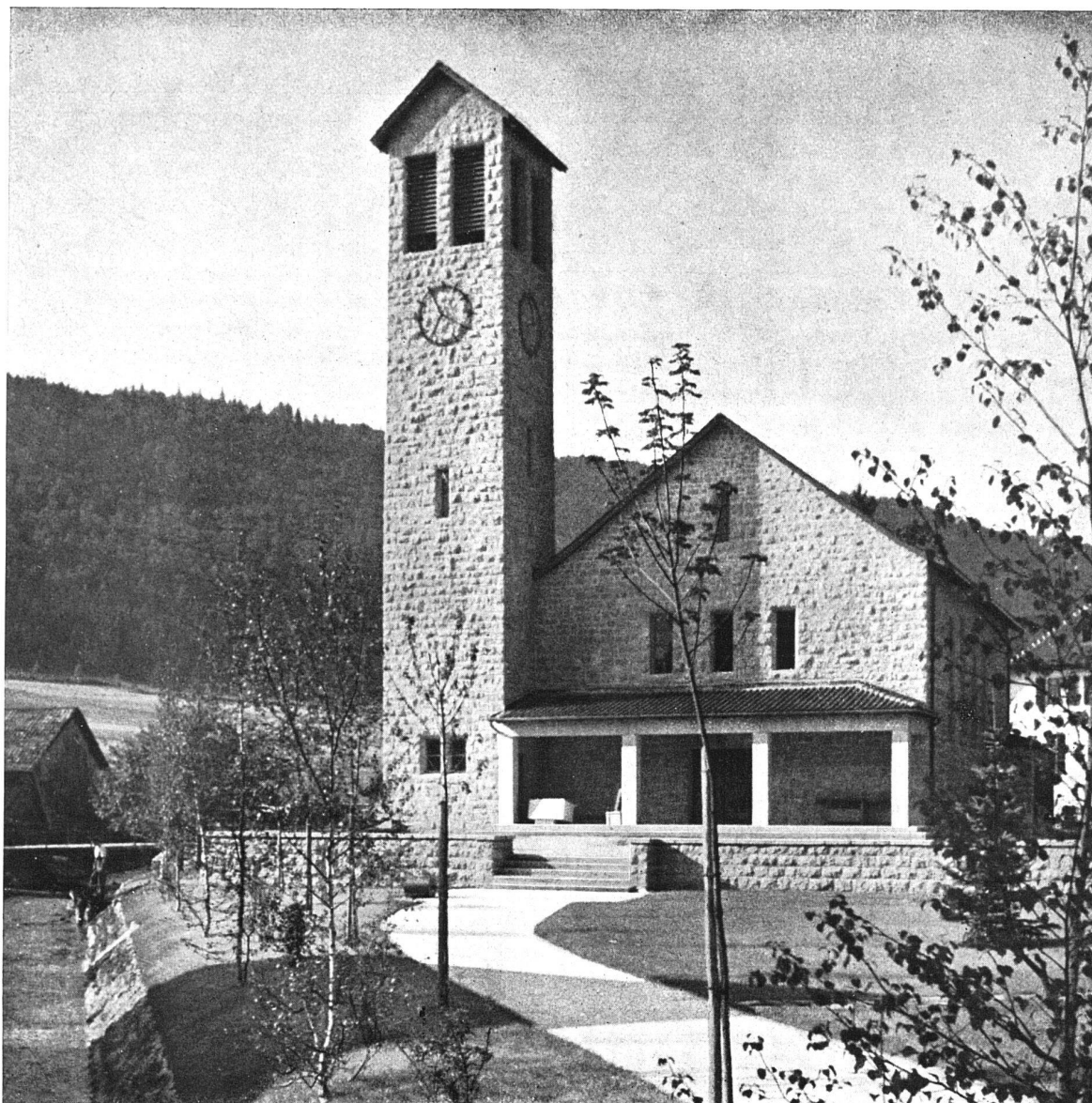
Eglise protestante de Villeret Charles Kleiber, architecte FAS, Moutier