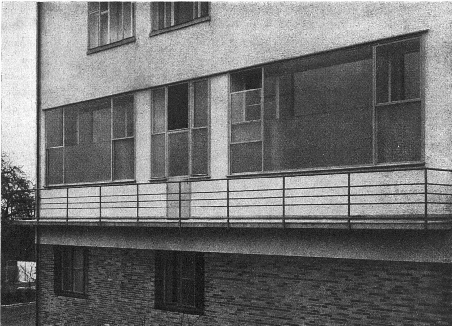
Krankenhaus Thalwil. Operations- saalfenster mit Garny-Lüftung. Architekten: Müller & Freytag, Thalwil

Operationssaalfenster mit einfacher und doppelter Verglasung. Lüftungsflügel System Garny