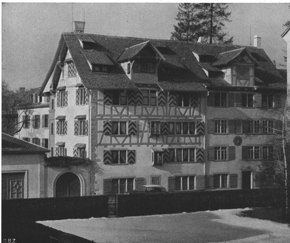
oben: Ecke Bäregasse- Talacker, im Vordergrund das Haus «Zur Arch». Ein Rest Alt-Zürich mitten in der Großstadt