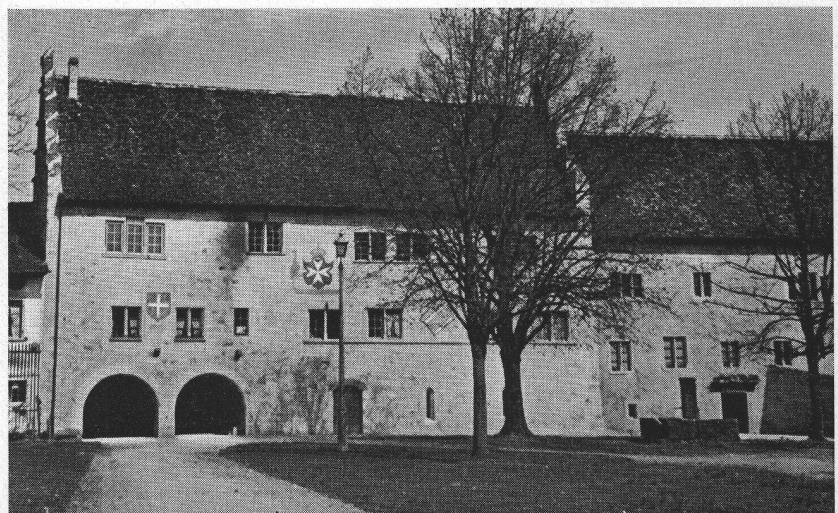
unten: Der Hof, in dem die Kreuzritterspiele 1936 abgehalten wurden