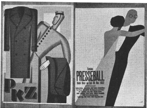
Herbert Matter, 1928 rechts: Ernst Keller, 1932