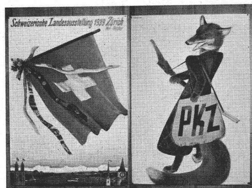
Alois Carigiet, 1939 rechts: Alois Carigiet, 1935