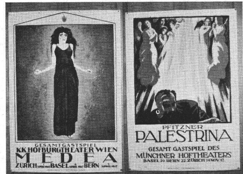
Otto Baumberger, 1917 rechts: Emile Cardinaux, 1917