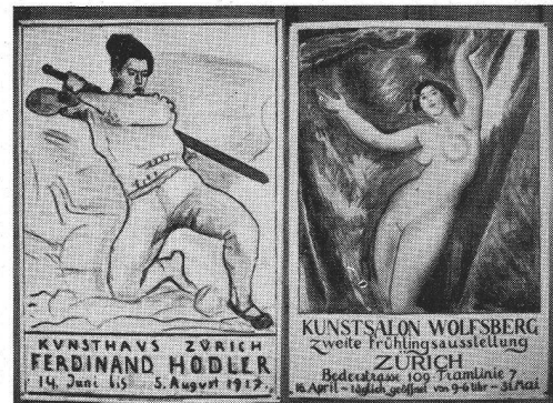
Ferd. Hodler (Lithogr. von O. Baumberger), 1917 rechts: Alexandre Blanchet, 1918