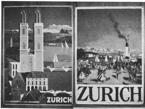
Otto Baumberger rechts: Otto Baumberger, 1918