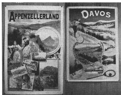
M. Annen, 1890 rechts: Atelier Orell-Füssli, 1901.

Die um 1890—1895 entstandenen Plakate zeigen rein illustrativen Charakter. Sie sind erzählend und in diesem Eifer, möglichst viel in Schrift und Bild mitzuteilen, formal indiszipliniert. Mit dem Aufkommen des Jugendstils um 1894 geht das Plakat von der illustrativen Anhäufung von Motiven zu ausgesprochen allegorischen Lösungen über. Es ist die Zeit der zahnradtragenden, lorbeergeschmückten Frauen, der mit einer Lyra bewaffneten Schwäne, wobei sich, der Tendenz des Jugendstils entsprechend, auch immer wieder das Symbol in die Darstellungen schiebt. Diese Tendenz hält sich bis um 1906 mit verschiedenen Schwankungen, Vorstössen und Rückfällen, bis dann die spezifischen Elemente des Plakates sich deutlicher abzeichnen beginnen. Vorerst beispielsweise 1905 im Plakat für das Eidg. Sängerfest in Zürich, von Burkard Mangold, das noch im Jugendstil konzipiert, schon im besten Sinne plakatmässig aufgefasst ist. Auch werden die Möglichkeiten der Lithographie wieder mehr ausgeschöpft, da nicht mehr allein aus dem Motiv heraus, sondern vielmehr aus dem Material