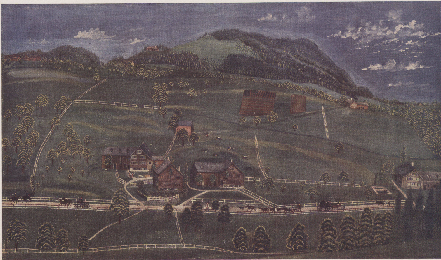
7. „Thal“ mit Rosenberg bei Herisau, von unbekannter Hand.