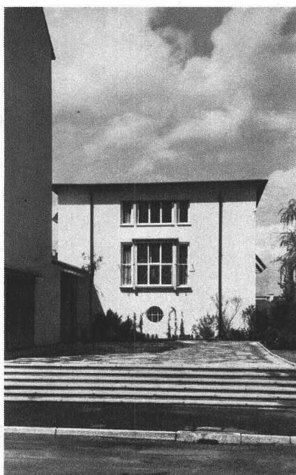
Ueber dem Eingangsportal ist ein Fresko vorgesehen; auf dem Postament, das die Freitreppe flankiert, soll eine Statue des St. Johannes Bosco Aufstellung finden