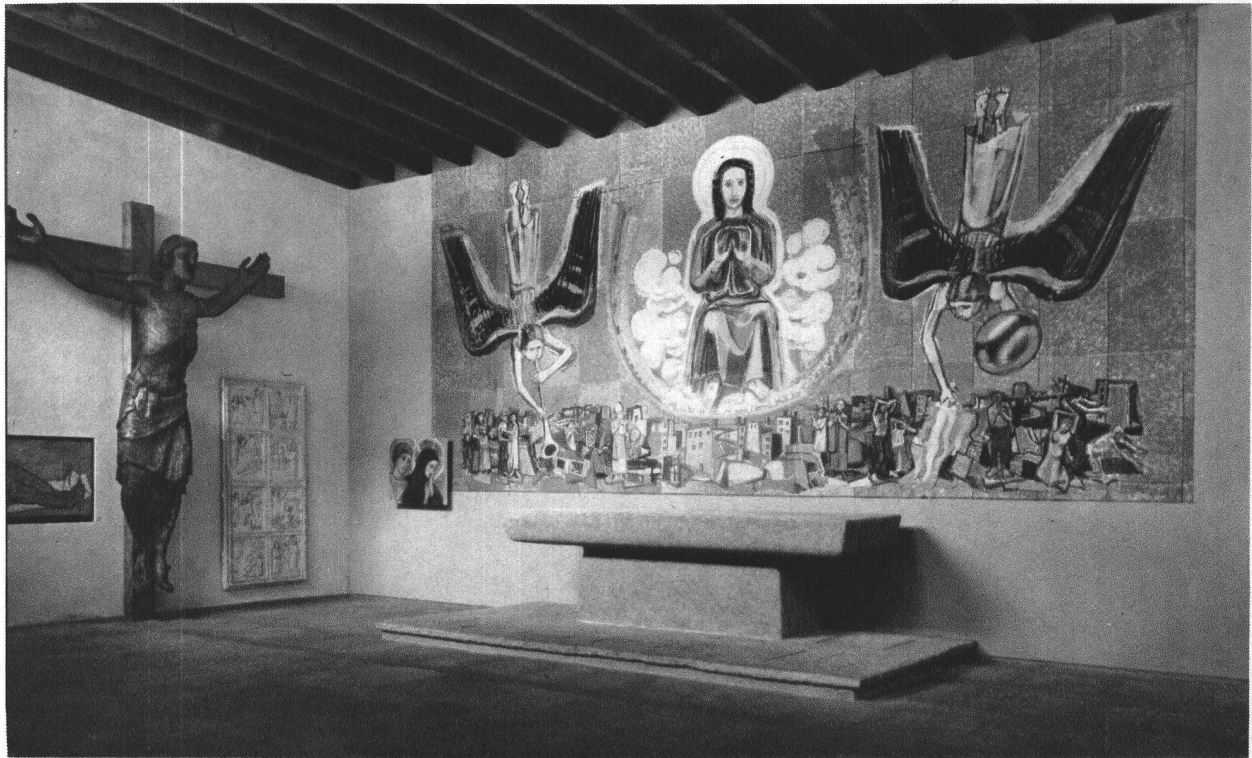
Pavillon für christliche Kunst LA 1939 Arch. F. Metzger BSA, Zürich