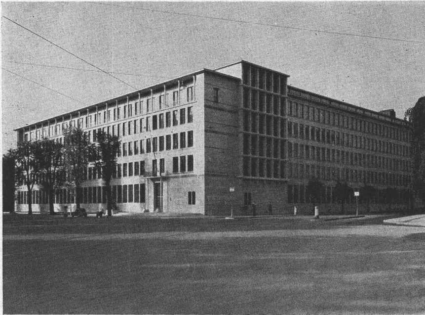
Schweizerische Lebensversicherungs- und Rentenanstalt Zürich Architekten: Gebr. Pfister, Zürich

Terrassenbeläge zirka 1000 m 2 Isolation der Kellerräume gegen Grundwasser zirka 4500 m 2