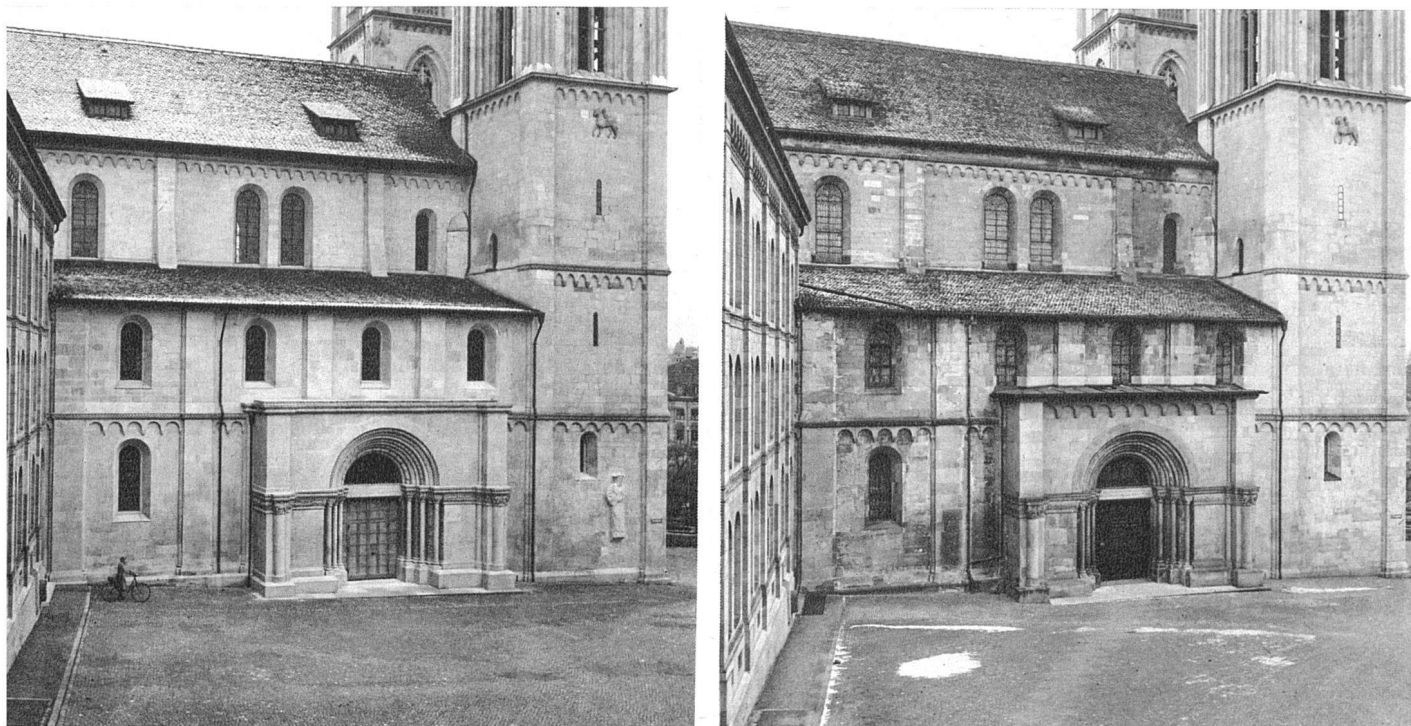
Links der neue, rechts der alte Zustand der Nordseite