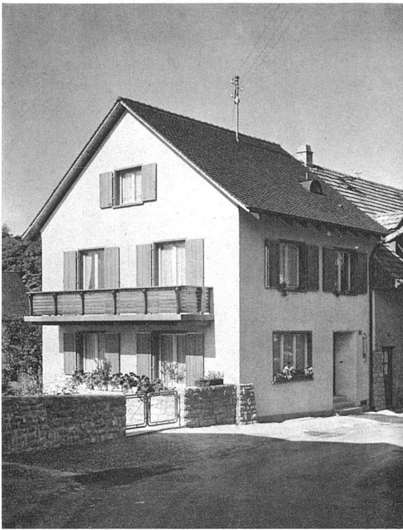
Wohnhaus W. P.-K., Riehen, Kirchstrasse 19 Architekt Max Henke, Riehen