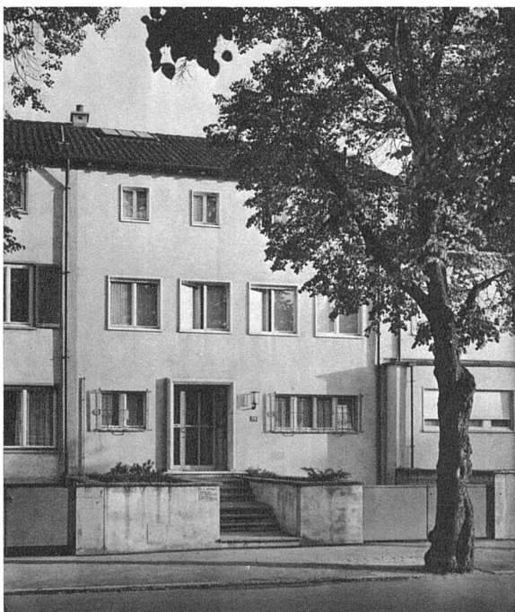
Wohnhaus Dr. E. N., Basel, Neubadstrasse 75, erbaut 1939/40 Architekten: Suter und Burekhardt BSA, Basel

Baufaufgaben gliederten sich in Reihenhäuser, Doppel- und Gruppenhäuser sowie freistehende Gebäude. Die anspruchsloseste bietet das Reihenhäuser, wobei aber gerade hier für eine glückliche Gestaltung verschiedene Schwierigkeiten zu überwinden sind, die sich aus dem vorgeschriebenen Grundriss und der viel Takt erfordernden Anpassung an die Nebenbauten ergeben. Nur die Raumaufteilung verleiht dem Hause das unerlässlich Selbständige, und von hier aus lässt sich auch eine Nuancierung der äusseren Erscheinung vornehmen. Ähnliches gilt für die Gruppen- und Doppelhäuser, obwohl sie eine bereits freiere Disposition erlauben, nicht so an die Strassenzeile gebunden sind, sei es in der Dachneigung, der Fensterverteilung oder Balkonführung. Eine gewisse Rolle hier wie dort spielt der Vorgarten, dessen Anlage im Sinne einer durchgehenden Rasenterrasse erfreuliche Ansätze zeigt. Als beste Lösungen wurden ein in die Reihe gebautes Haus (Neubadstrasse 75) und ein Doppelhaus (Beim Wasserturm 4/6) gewählt, die sich schlicht und natürlich geben, sauber in der Ausführung sind und der Situation angemessen.