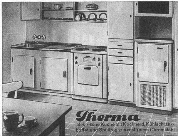
Therma elektrische Küche mit Kochherd, Kühlschrank- buffet und Spülrog aus rostfreiem Chromstahl