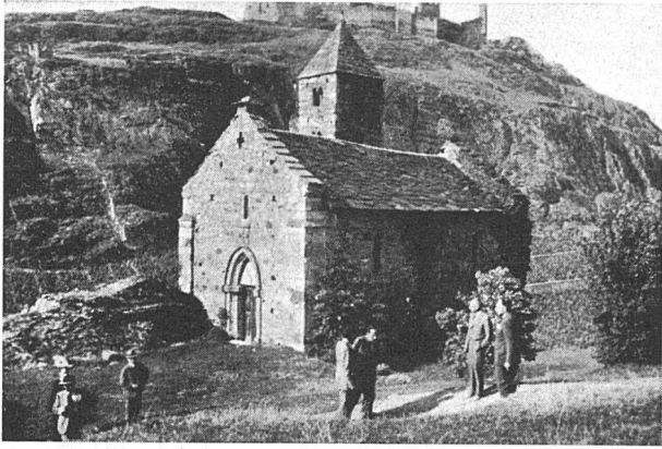
Allerheiligen-Kapelle am Aufstieg zur Kirche Notre Dame de Valère