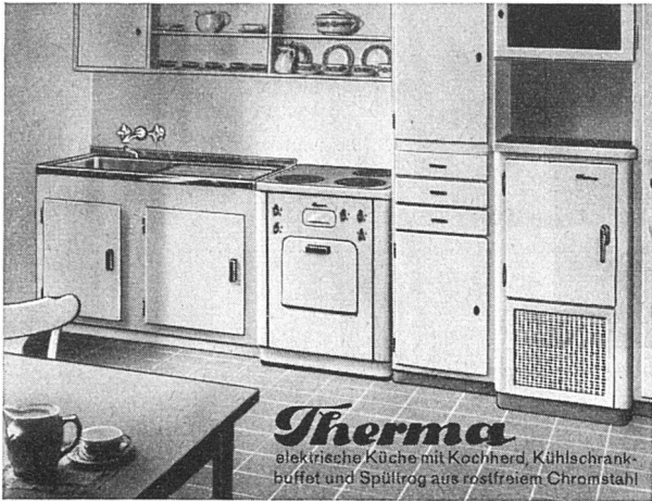
Therma elektrische Küche mit Kochherd, Kühlschrank, buffet und Spülrog aus rostfreiem Chromstahl

Bahnhofstrasse 18, Zürich Gleiches Haus in St. Gallen