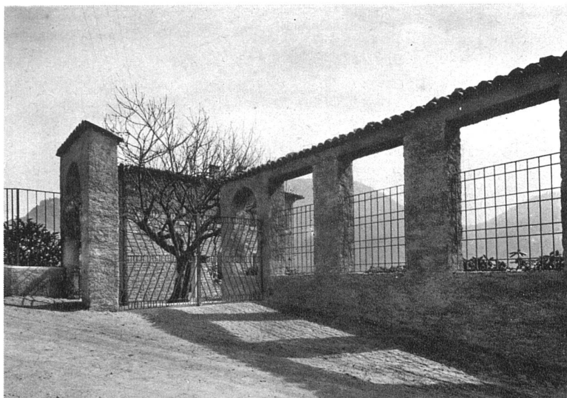
Ingresso al giardino. Muratura in pietrame intonacata rustica, inferriate e cancello in ferro verniciato verde-oliva