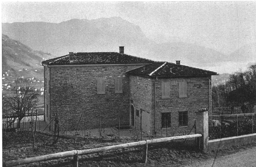
Facciata settentrionale, vista della strada

1 ingresso dalla strada, 2 piazzale interno, 3 piazzale nel giardino, 4 giardino, 5 vigneto