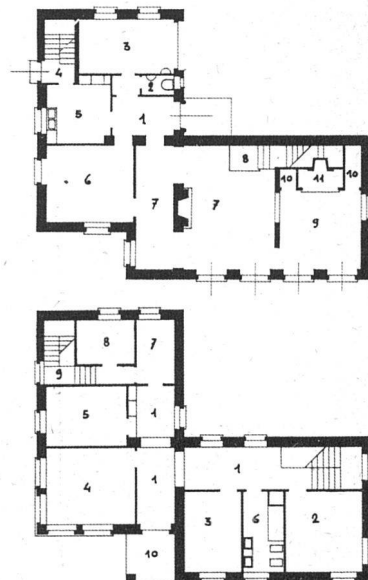
Piano terreno 1:400 primo piano 1:400

Casa S. in Porza. Architetto Cino Chiesa, Lugano-Cassarate