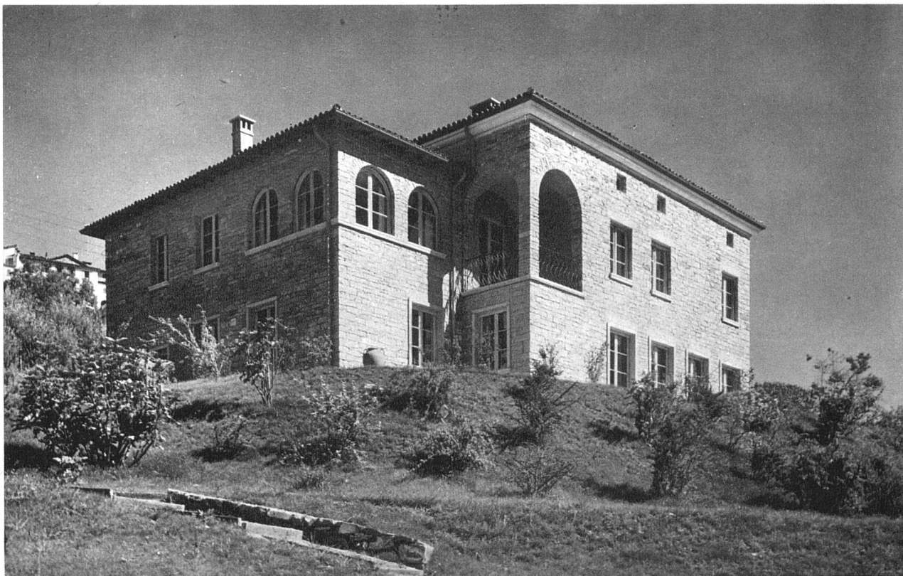
Veduta generale della casa, dal giardino. Muratura in pietrame di granito di Riviera a giunta magra, contorni delle aperture in granito bianco di Verzasca.