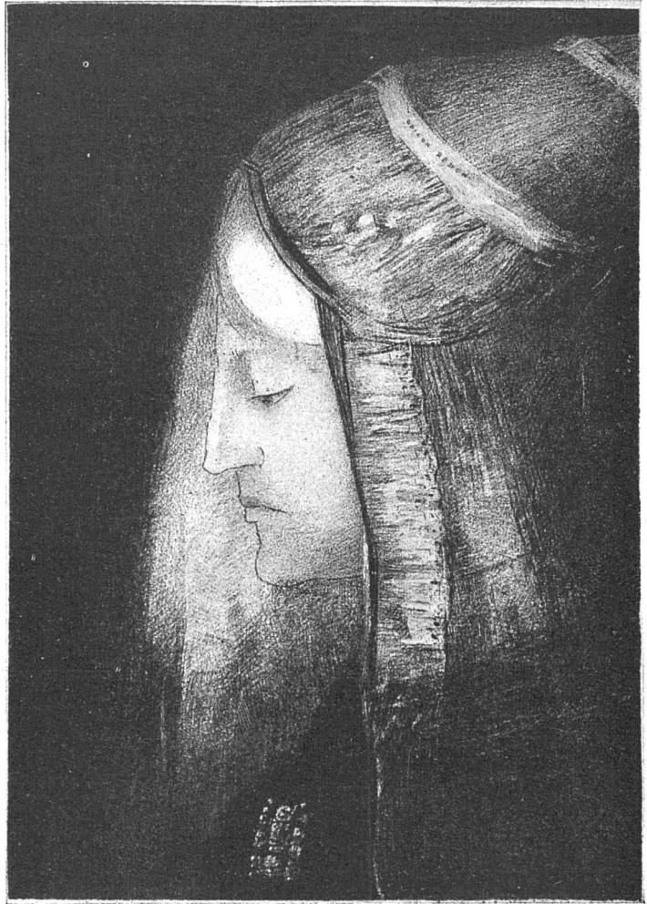
«Profil de Lumière»

hellster Bewusstheit. Auch hier zwischen Kopf und Schwanz fast kein Körper: Anfang und Ende, Ur-anfang und Letztes; wenig Mitte, nur extreme Ge-spanntheit; auch im Kleinsten.