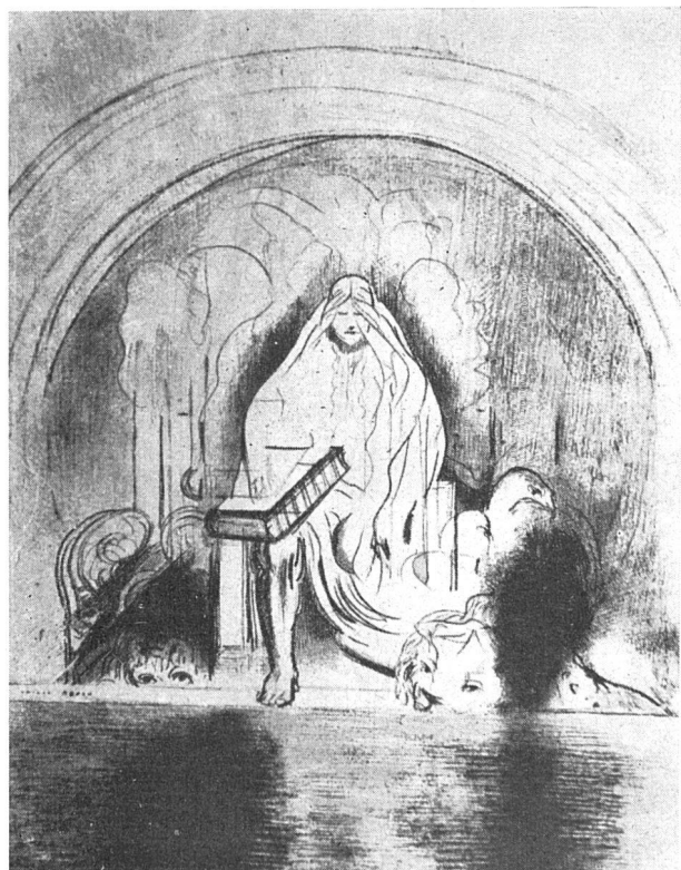
Aus der Folge «Apocalypse»