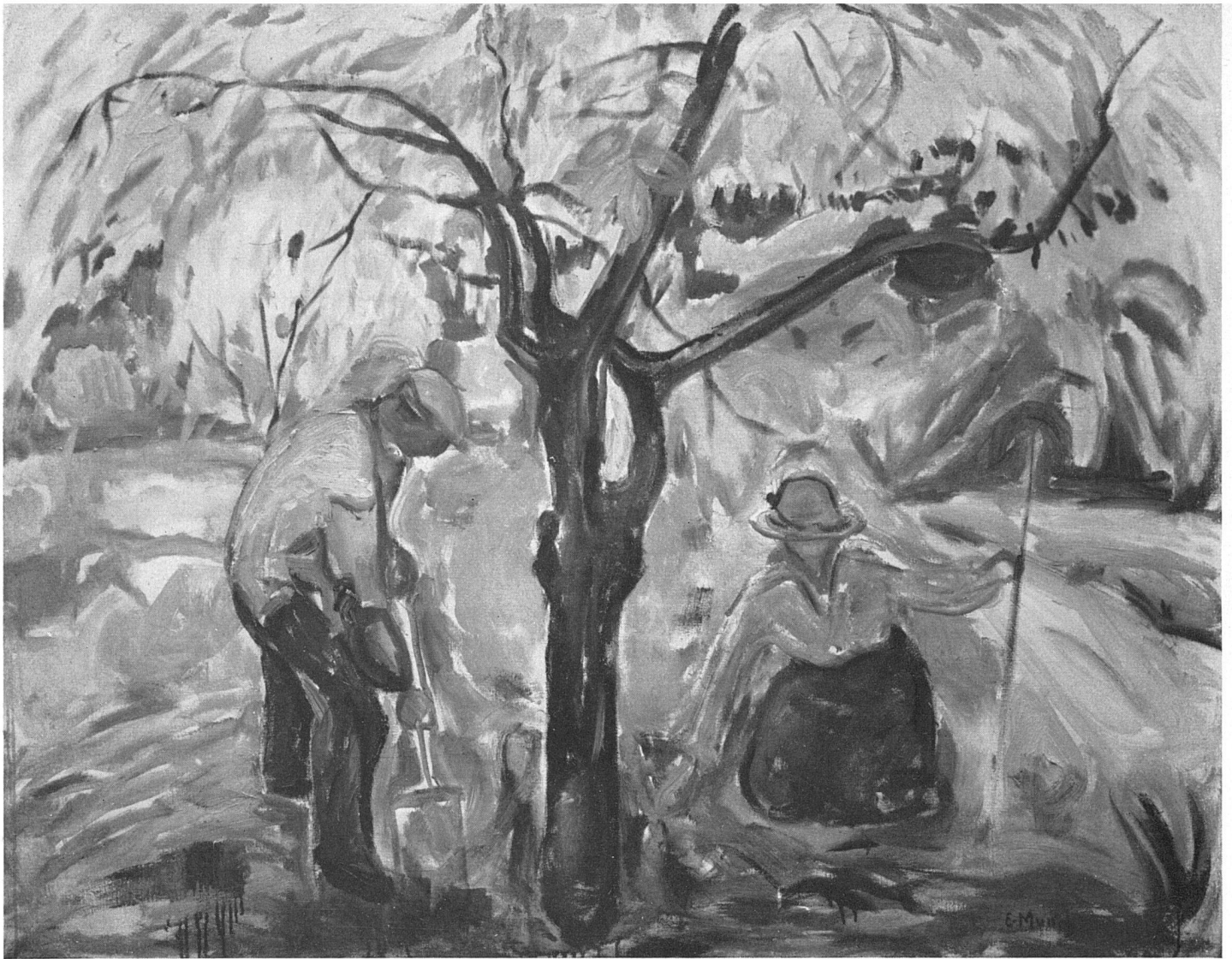
Edvard Munch Apfelbaum 1921