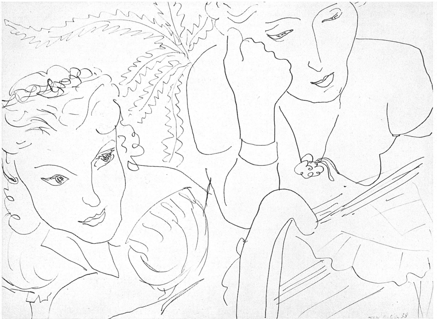
Henri Matisse Federzeichnung 1938