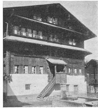
Großhaus in Elm. Giebel und Ausbau des 3. Geschosses aus dem Jahre 1587. Der übrige Bau ist älter

wirtschaftliche Bauamt Brugg – Einzelhöfe und ganze landwirtschaftliche Siedlungen.