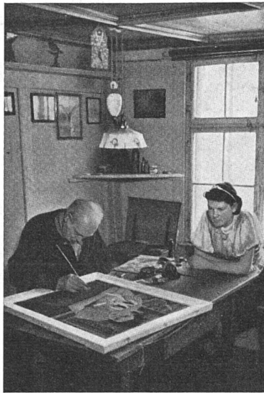
Der Maler Adolf Dietrich

Von einigen sachlichen deutschen und amerikanischen Zeitungskritiken abgesehen, ist das kürzlich erschienene Buch tatsächlich das erste, das die niedlichmachenden und tendenziösen Prädikate « Bauernmaler », oder « Holzfäller und Maler », die bis dahin den