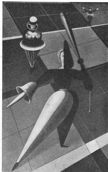
Das Triadische Ballett. Abb. aus «Die Bühne im Bauhaus». Bauhausbücher, Band IV, 1925.

Paul Klee, James Joyce, Louis Marcoussis, Robert Delaunay, Sophie Täuber-Arp starben in den letzten Jahren. Verschiedene Persönlichkeiten, verschiedene Intensitäten, aber doch darin sich gleichend, daß sie seit Jahrzehnten an einer neuen künstlerischen Sprache, an einer kommenden Zeit kompromißlos, standhaft und unbe-