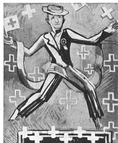
« Si spile mit Basler Altstadt-Staibaukletzli »

« Kai Kryzlischwemmi ihm geniegt - Kai Ertli, wo kai Fähnli fliegt - »