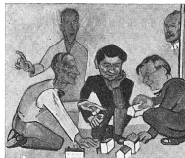
Will Ziri s'fachlig Kenne vo den Architektschetzt, Isch jeden amllig Poschte guet mit B-S-A-Lytt bsetzt