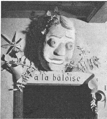
Dekoration im Kloster Klingenthal. Bemalung Otto Staiger