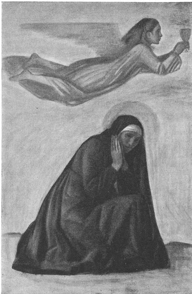
Im Zürcher Kunsthaus wurde am Samstag, den 16. Oktober die XIX. Ausstellung der Gesellschaft Schweiz. Maler, Bildhauer und Architekten eröffnet. Sie vereinigt über 600 Werke von 340 Künstlern und umfaßt alle Ausstellungs- und Sammlungsräume im 1. und 2. Stock des Kunsthauses. Aus dieser Ausstellung reproduzieren wir das obenstehende Bild von Pietro Chiesa: L'adorata, détail du carton pour une crucifixion, église de Perlen.