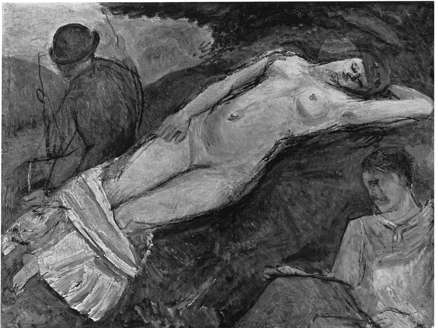
René Auberjonois Komposition