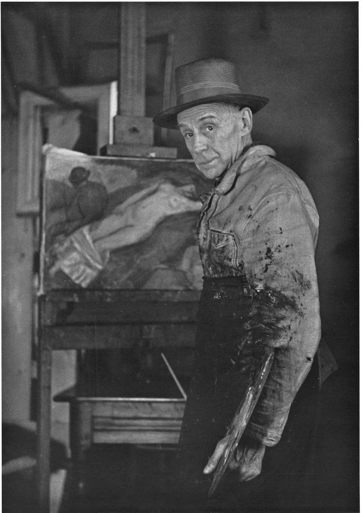
Der Maler in der Werkstatt