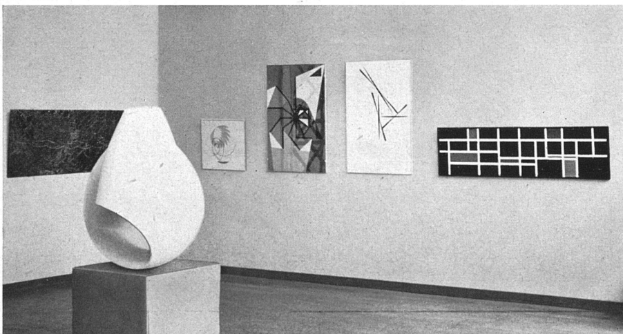
Max Bill Konstruktionen 1935-1942 Im Vordergrund «Unendliche Schleife»