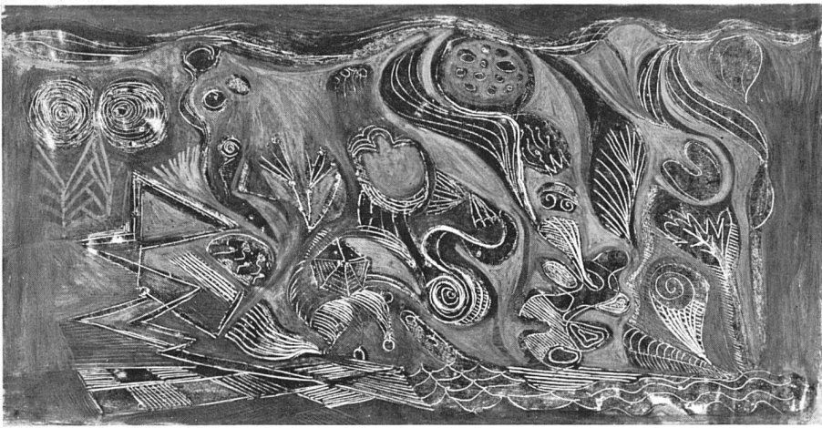
Serge Brignoni Projet pour peinture murale 1940