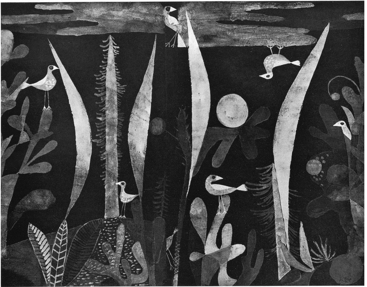
Paul Klee Landschaft mit gelben Vögeln 19

bilden überwiegt das Passiv-Melodische: die Farbe. Und auch die Form ist mehr melodisch als rhythmisch verwendet (Bodmer, Fischli, der ungegenständliche Klee).