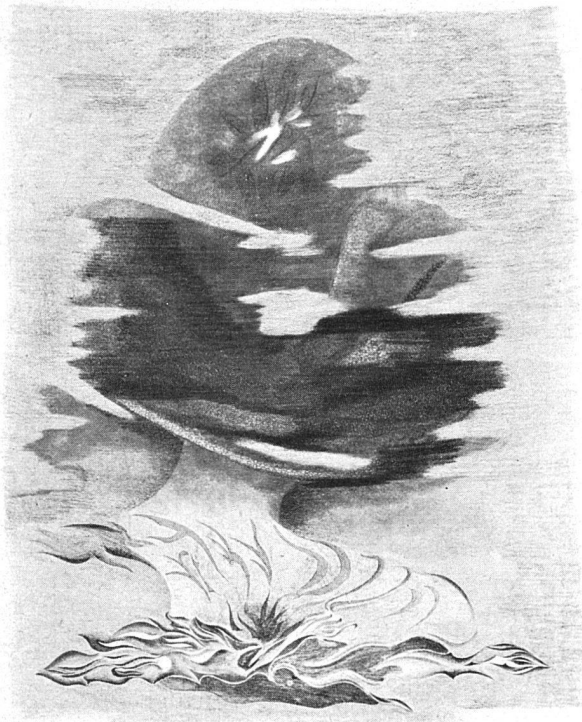
Hans Fischli Farbige Zeichnung 1942