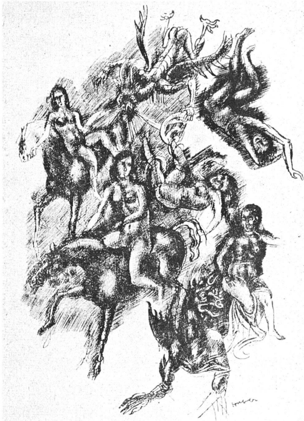
mann Huber Federzeichnung 1915