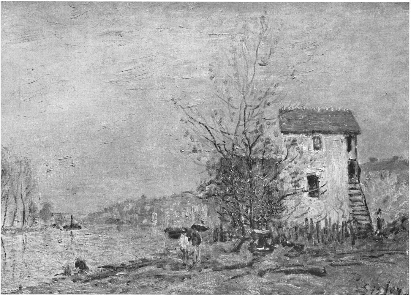
1 Sisley Am Fluß

nen Jahres gehörten die Werke von Géricault, die allerdings fast ausschließlich aus einer einzigen Sammlung stammten. Géricault ist auf der Ausstellung in Basel nur mit zwei Kopien nach Tizian und nach Ribera vertreten. Aber er ist auch als Kopist ein großer Künstler. Er hat mit der selben Größe wie Rubens, Delacroix, Courbet, Manet und Leibl kopiert. Von den beiden Kopien nach Tizian (« Dornenkrönung ») und Ribera (« Mater dolorosa ») geht eine großartige Wirkung aus. Solche Bilder sind weniger eigentliche Kopien als gemalte kritische Dialoge mit diesen Meistern. Solche Kopien sind originalen Schöpfungen ebenbürtig. Erst ein Vergleich mit den Originalen vermöchte aber die geniale Einfühlungskraft, die produktive Übersteigerungsfähigkeit von Géricault zu erweisen. Das große Kapitel der Kunstgeschichte, das den Titel « Schöpferische Kopie » trägt, ist bis heute noch nicht geschrieben worden.