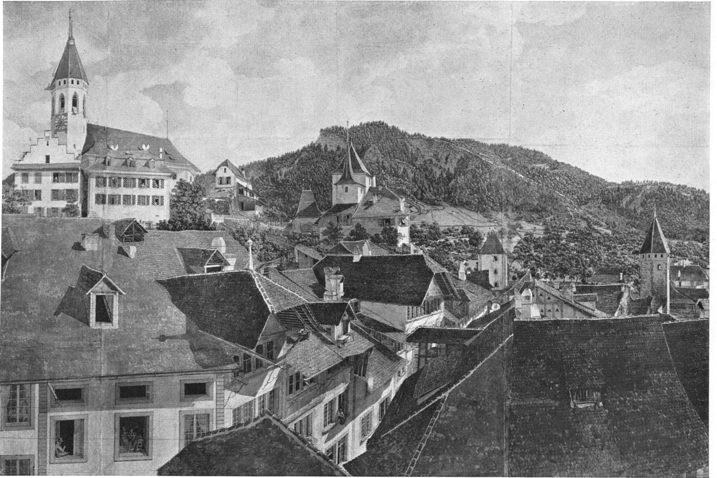
Marquard Woher Panorama von Thun 1809