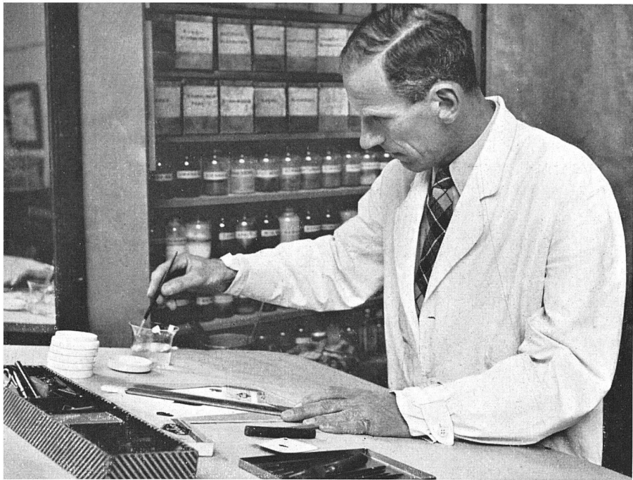
Bei der Arbeit