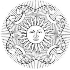
Verkehrsverein St. Moritz Entwurf W. Herdeg SWB