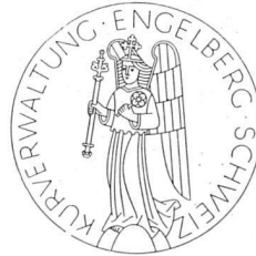
Verkehrsverein Engelberg Entwurf H. Eidenbenz SWB