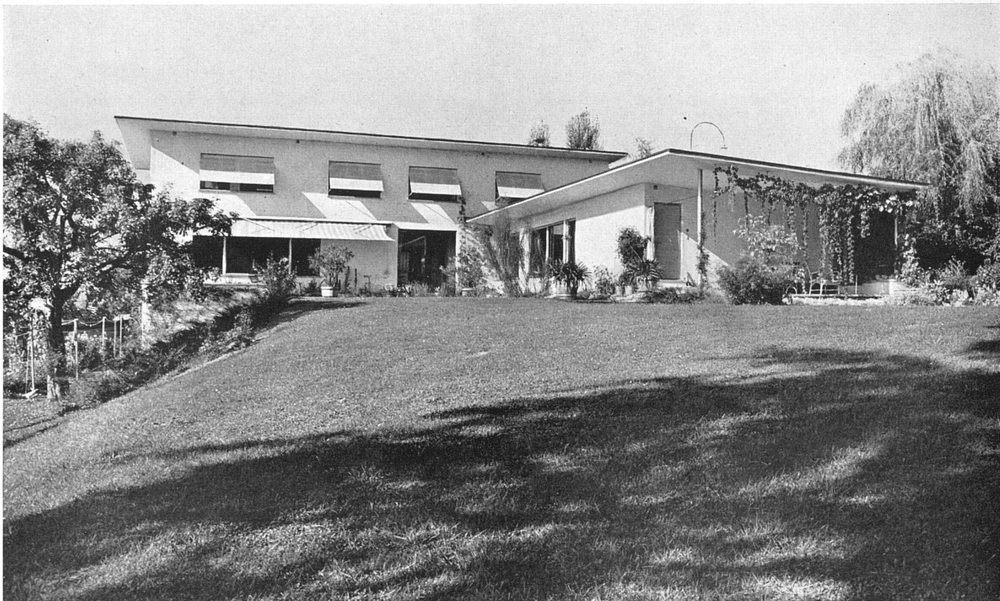
Im Gebäudewinkel liegt windgeschützt der Wohngarten