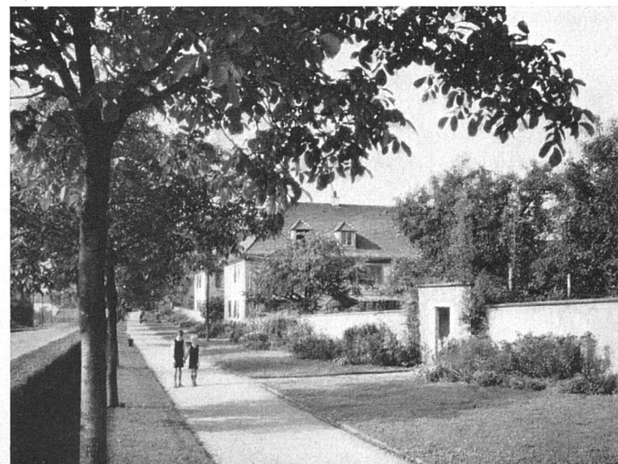
Gartenabschluß mit lockeren Hecken Siedlung Neubühl