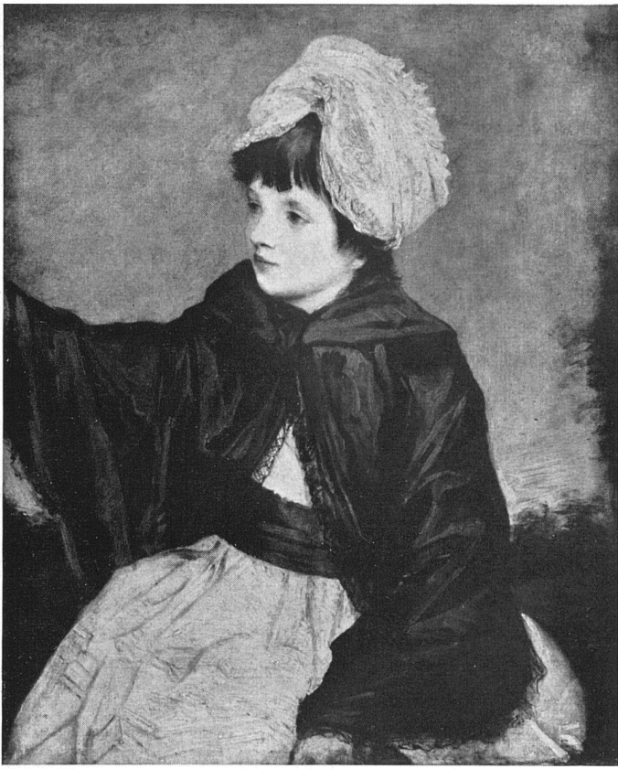
Josuah Reynolds Lady Isabella Howard