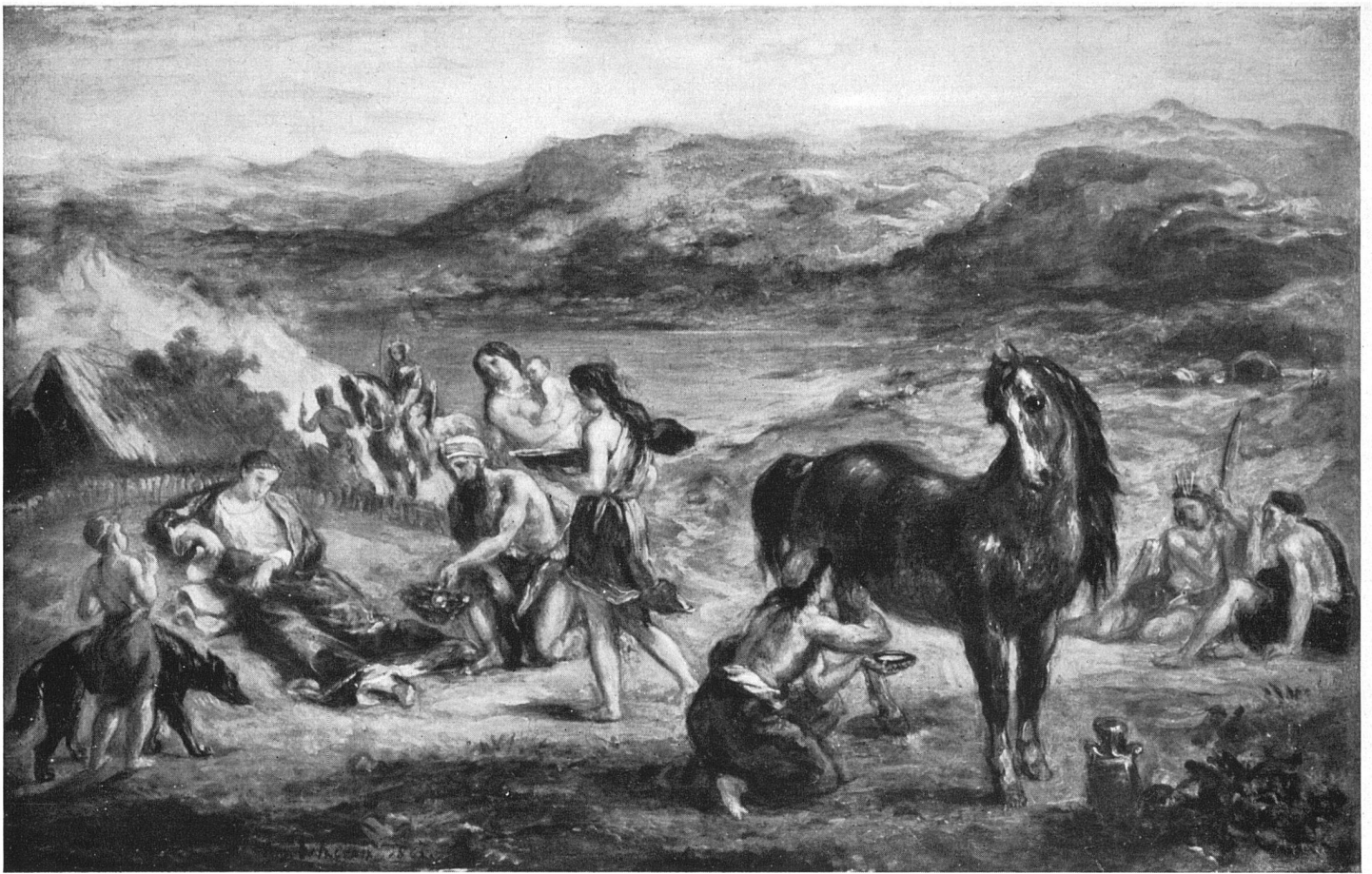
Eugène Delacroix Ovid bei den Skythen

französische Malerei des zwanzigsten Jahrhunderts zusammen. Vor allem ist die französische Plastik des neunzehnten und zwanzigsten Jahrhunderts reich vertreten: mit Rodin, Degas, Maillol, Despiau, Pompon, Germaine Richier. Die deutsche Plastik des neunzehnten Jahrhunderts spärlich mit Hildebrand, reich mit Georg Kolbe und Wilhelm Lehmbruck, Ernst Barlach, August Gaul. Gerade diese Plastiken zwingen zu einer vergleichenden Betrachtung französischer und deutscher künstlerischer Gestaltung: wobei sich zeigt, wie stark sich der französische Einfluß in der deutschen Plastik auch dort noch bemerkbar macht, wo er bewußt zu überwinden versucht wird. Lehmbruck sentimentalisiert die plastische Form, Despiau sensibilisiert sie. Diese Abteilung wird durch Bildhauerzeichnungen ergänzt, in denen auf der Fläche erscheint, was diese Künstler im Raum beschäftigt. Die Malerei ist ohne Pedanterie auf die verschiedenen Stockwerke und Säle verteilt: viel weniger von einem Konservator als von einem Kunstliebhaber gehängt, so daß man schon dadurch immer wieder darauf geführt wird, daß es sich hier um eine Ausstellung handelt, in der doch vor allem der zürcherische Privatbesitz zur Geltung kommen soll.