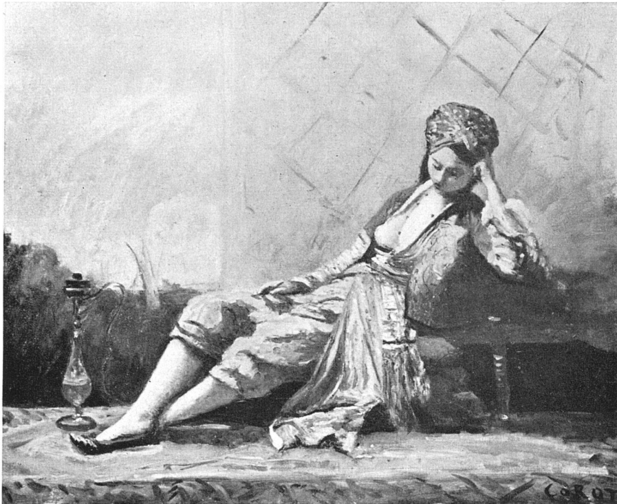
Corot Femme grecque