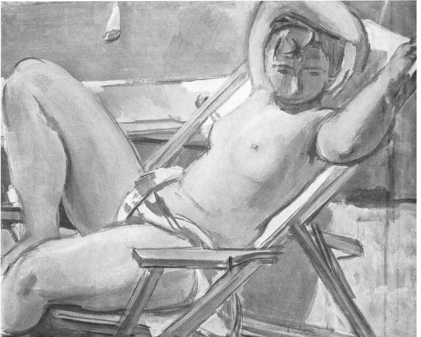
Maurice Barraud Liegender Akt