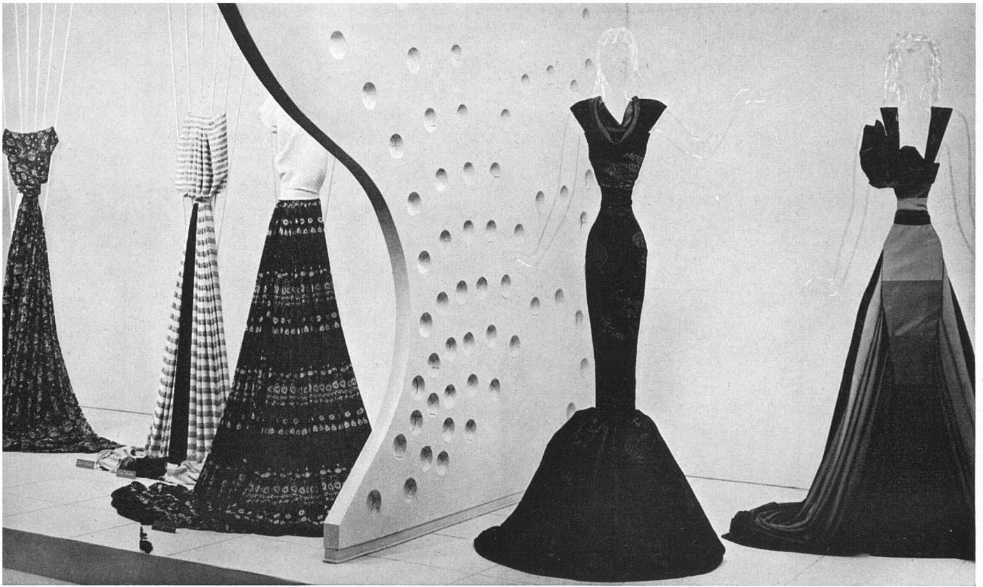
Querschnitt der Abteilung «Seide» Einzelausstellungen