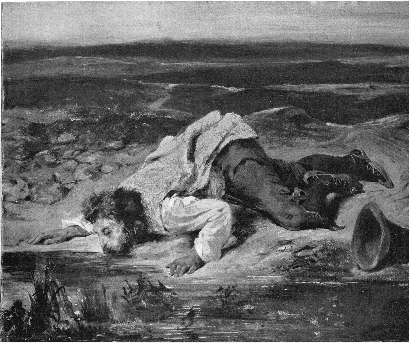
Öffentliche Kunstsammlung Basel