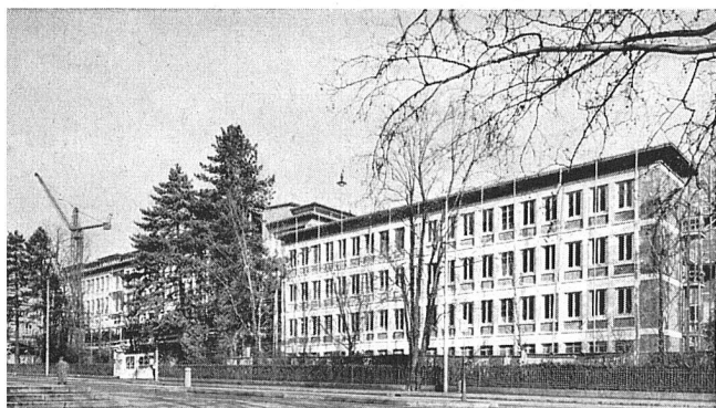
Klinik im heutigen Bauzustand