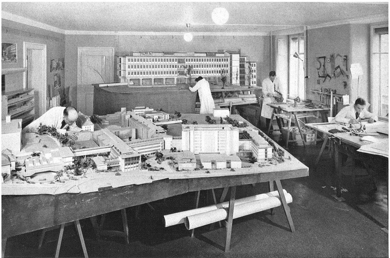
die Modellwerkstatt der A. K. Z.