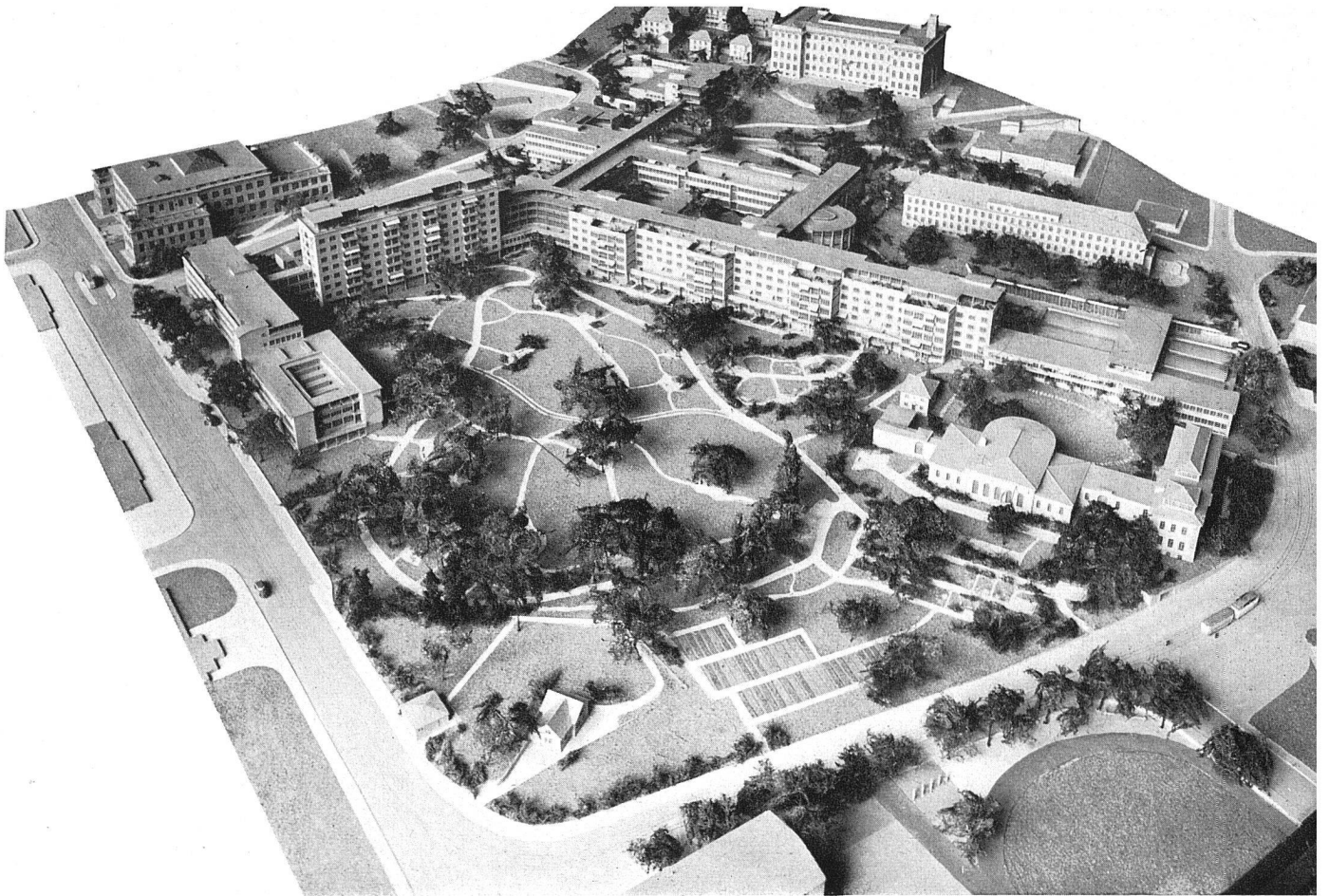
Modellansicht aus Süden, links die Rämist