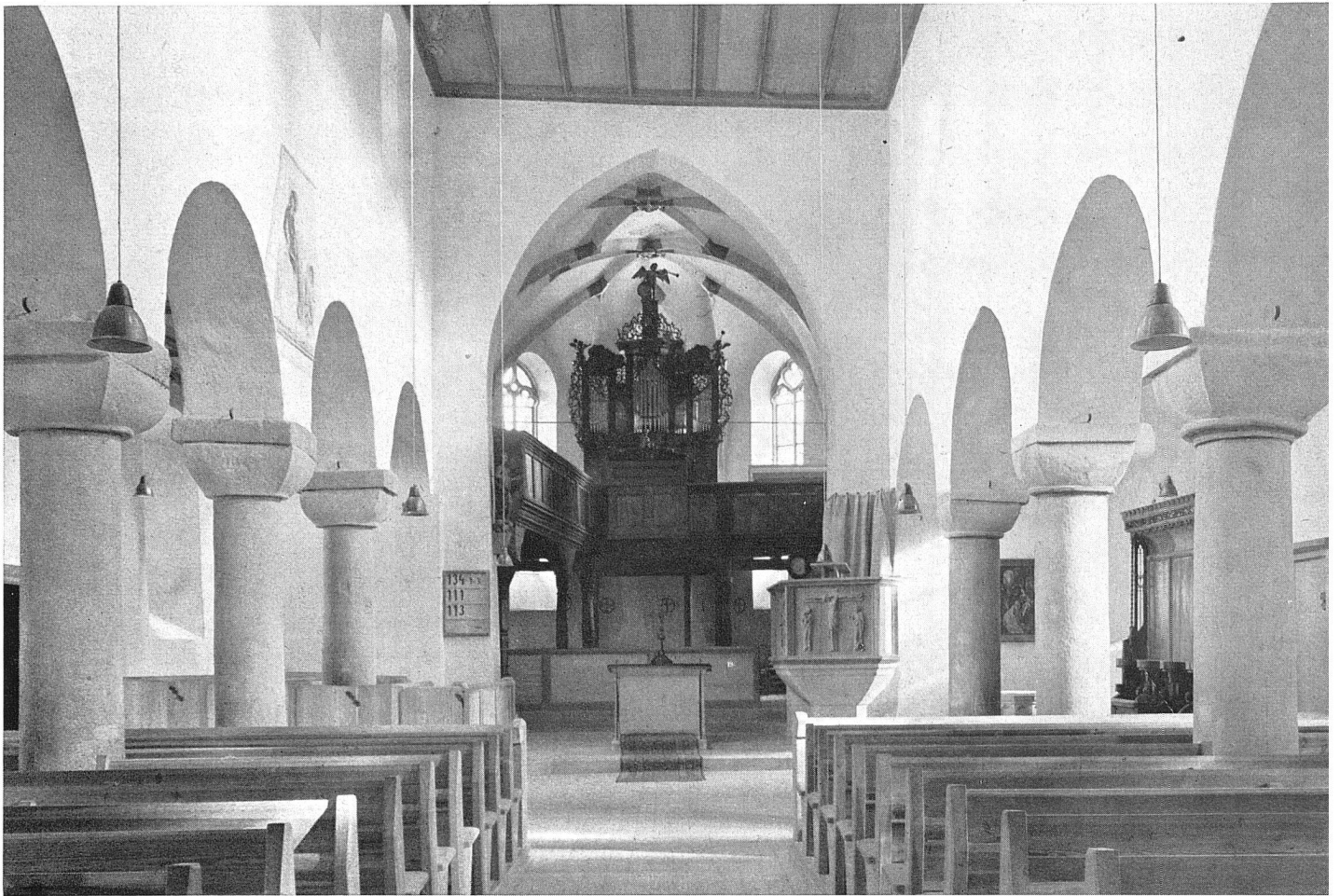
Kirche Oberlenningen Zustand nach der Restauration: neue Holzdecke, frei gelegte romanische Hochwandfenster, Backsteinfußboden, niedere Kanzel elektrische Beleuchtung

das Gegenteil lehrt. Heute sagen wir: Auch hier kann nur von Fall zu Fall geprüft und geurteilt werden. Gewiß ist nicht zu bestreiten, daß stielechte Nachbildungen oft eine Unwahrheit bedeuten; dennoch sind sie nicht unbesehen abzulehnen. Wo z. B. innerhalb eines größeren Zusammenhangs lediglich rein architektonische Einzelformen zu erneuern sind, wird es meist richtig sein, sich der Umgebung anzupassen. Wenn aber ein Gebädetrakt oder größere Teile ganz zu erneuern oder völlig neu herzustellen sind, wird eine Kopie nach alten Vorbildern schon fragwürdig. Sie aber ist unter Umständen trotzdem berechtigt, wo es sich um die Erhaltung eines ganz besonders eigenartigen Bildes handelt. Das kann durch eine Kopie bewerkstelligt werden, wenn die Einzelheiten lediglich baulicher Art sind und ihre technische Durchführung ohne wesentliche künstlerische Einzelformen möglich ist, wie z. B. die Bekrönung eines alten Stadtttores, die vielleicht vor fünfzig bis achtzig Jahren in einer unsachlichen und unkünstlerischen Art umgestaltet wurde und nun im alten Sinn nach altem Vorbild wieder hergestellt wird.